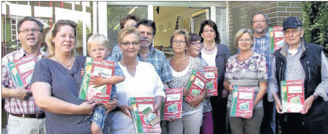
Viele Beteiligte, ein gemeinsames Ziel: Die Helfer des „Enser Warenkorbs“ und der „Künstlertreff Ense“ ziehen mit verschiedenen Aktionen für die Anschaffung eines Kühlwagens an einem Strang.

de des „Enser Warenkorbs“ zeigt sich angesichts dieses Engagements der Künstler begeistert. Denn deren Aktionen bilden einen wesentlichen Baustein zur Finanzierung des dringend erforderlichen Kühlwagens, da das bisher genutzte Fahrzeug seine Leistungsgrenze erreicht hat. Und wie sehr man dabei auf Unterstützung Dritter angewiesen ist, verdeutlicht vor allem die im Raum stehende Anschaffungssumme von 40 000 bis 45 000 Euro, die der Verein allein in keinem Fall aufbringen kann, wie man schon mehrfach betont hatte. ■ det